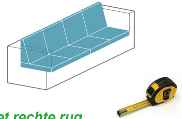
Romp met rechte rug.